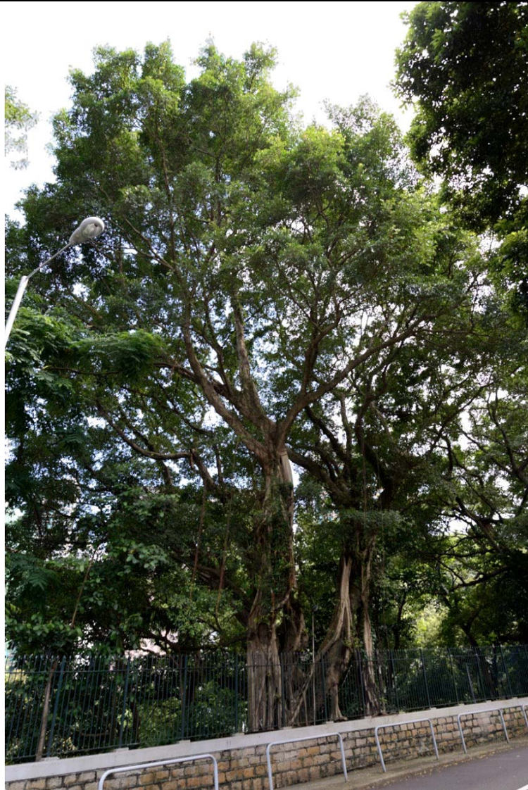
古樹名木編號 ArchSD CW/6 的外觀