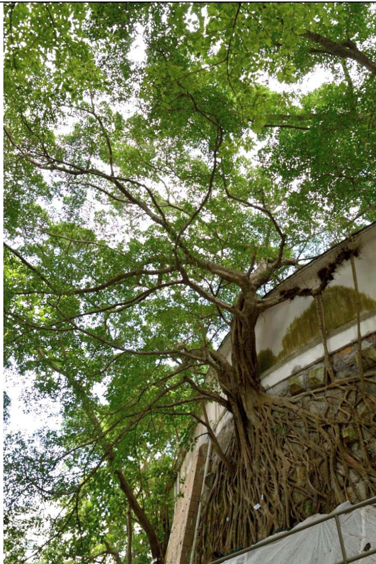
古樹名木編號 ArchSD CW/2 的外觀

特色: 本地品種、樹身巨大、擁有勻稱和蒼翠繁茂的樹冠、主幹及根部生長於石牆上，成為獨特的景觀特徵