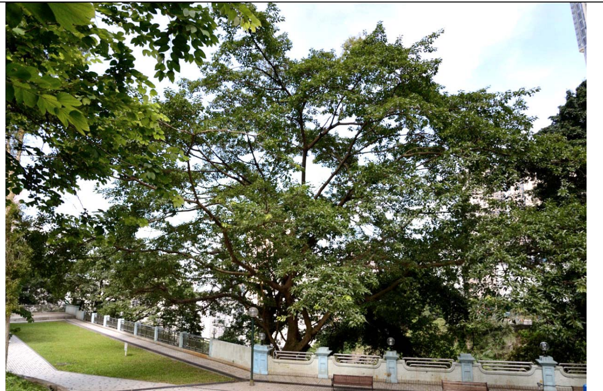
古樹名木編號 ArchSD CW/3 的外觀

特色: 本地品種、樹身巨大、擁有勻稱和蒼翠繁茂的樹冠、主幹及根部生長於石牆上，成為獨特的景觀特徵