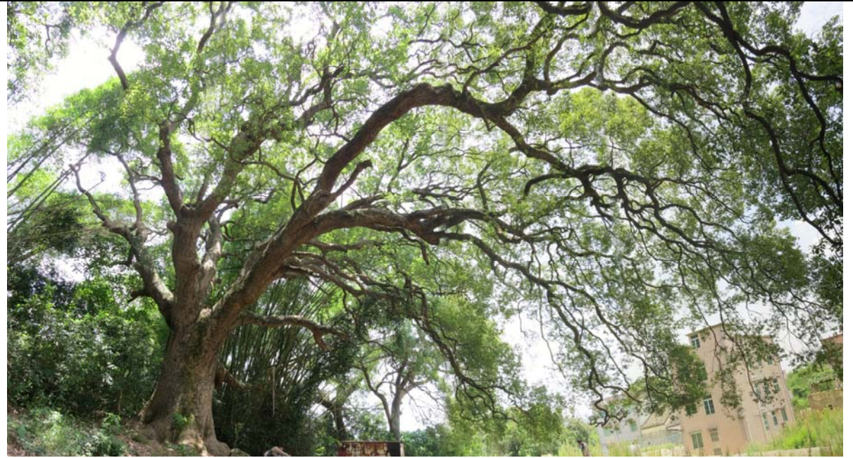
古樹名木編號 AFCD/HT/024 的外觀