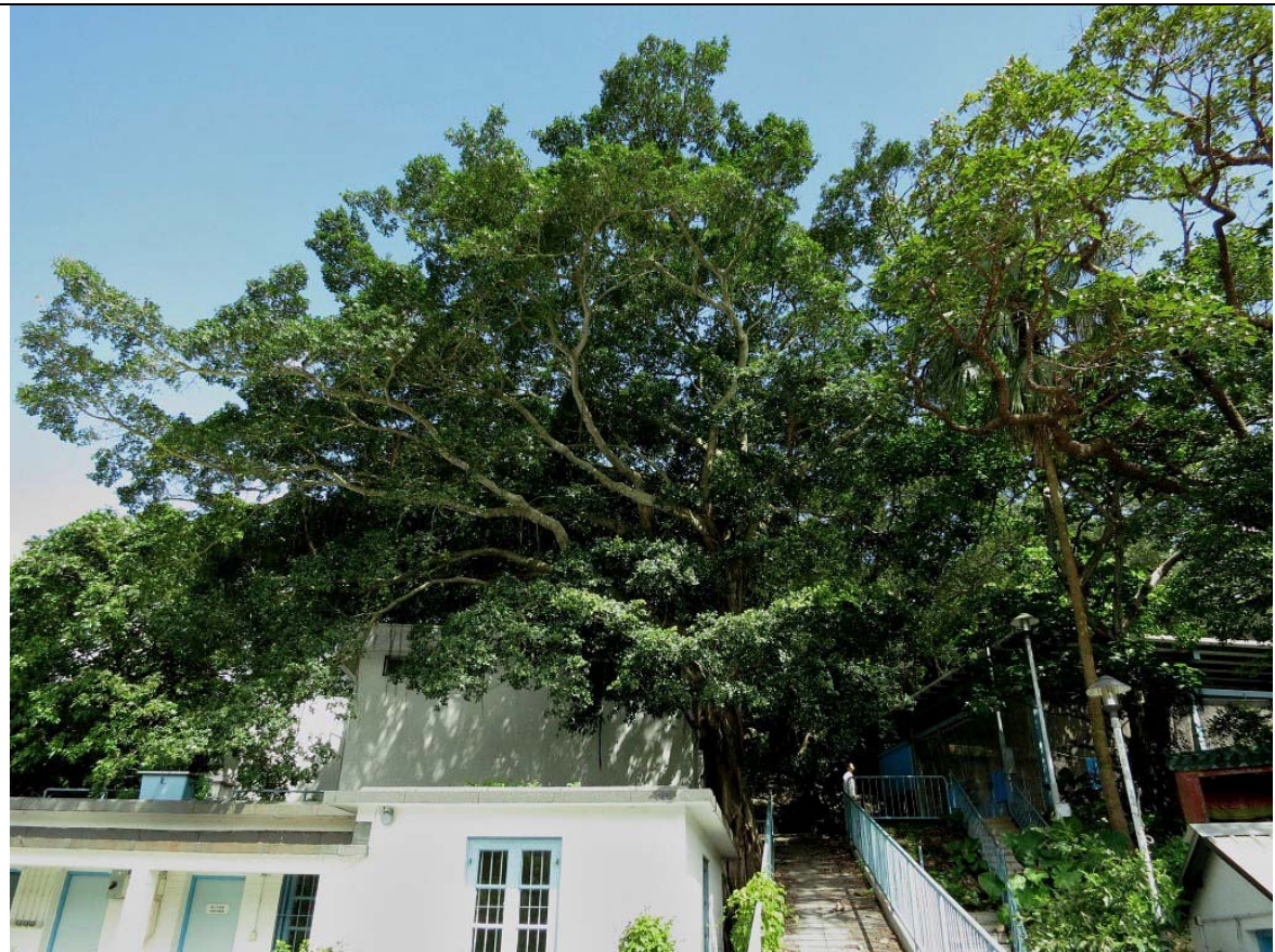
古樹名木編號 ArchSD S/1 的外觀

特色: 本地品種、樹身巨大、擁有勻稱和蒼翠繁茂的樹冠、主幹及根部生長於石牆上，成為獨特的景觀特徵