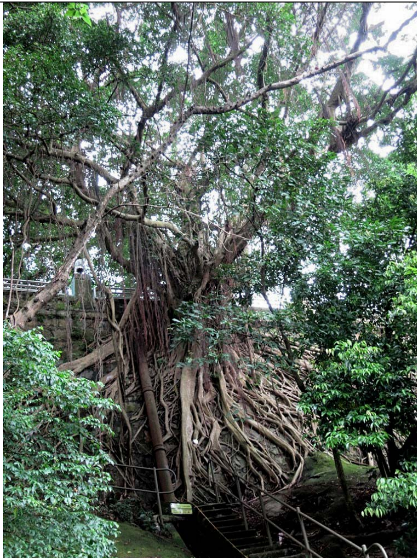
古樹名木編號 ArchSD CW/4 的外觀

特色: 本地品種、樹身巨大、擁有勻稱和蒼翠繁茂的樹冠、主幹及根部生長於石牆上，成為獨特的景觀特徵