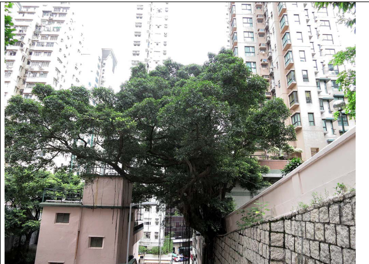
古樹名木編號 ArchSD CW/5 的外觀

特色: 本地品種、樹身巨大、擁有勻稱和蒼翠繁茂的樹冠、主幹及根部生長於石牆上，成為獨特的景觀特徵